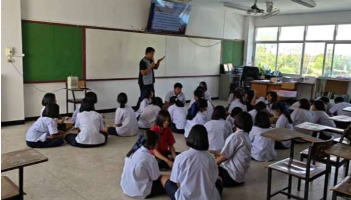
ภาพที่ ๑ ครูใช้คำถามกระตุ้นความคิดเพื่อนำเข้าสู่เนื้อหาเรื่องการอ่านจับใจความ และแบ่งกลุ่มพร้อมทั้งสมาชิกแต่ละกลุ่มแบ่งหน้าที่ศึกษา ค้นคว้า เรื่อง สวรรค์ในความเชื่อของชาวพุทธ ตามคติไตรภูมิพระร่วงด้วยเทคนิค KWL-Plus