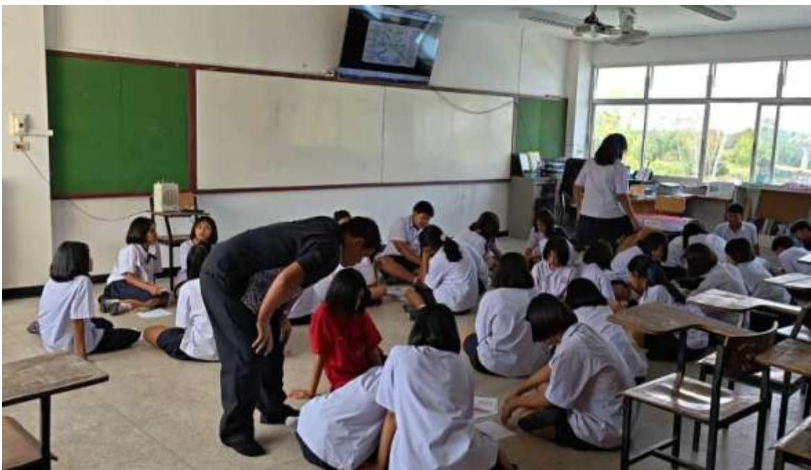
ภาพที่ ๒ ครูตั้งคำถามนำ นักเรียนรู้อะไรบ้างเกี่ยวกับสวรรค์บ้าง (K) และนักเรียนยังไม่รู้อะไรบ้างเกี่ยวกับสวรรค์ (W) และเมื่ออ่านบทความแล้วนักเรียนได้รู้อะไรบ้างเกี่ยวกับสวรรค์บ้าง (L)