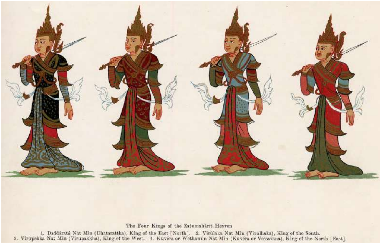
ภาพจอมเทพ ๔ องค์ผู้รักษาคู่ครองโลกใน ๔ ทิศ ซึ่งเรียกว่า ท้าวโลกบาล ท้าวจตุโลกบาล