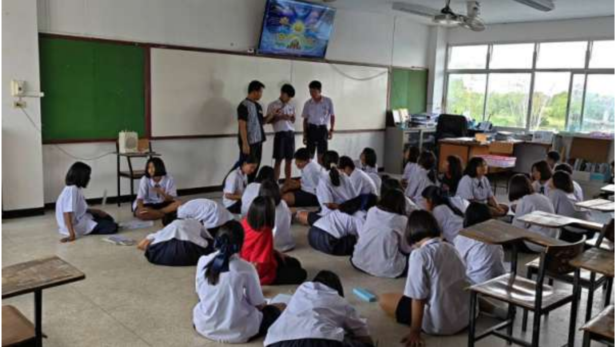
ภาพที่ ๓ นักเรียนใช้ Google Gemini AI ช่วยในการออกแบบแผนผังความคิด (AI-Generated Mind Maps) จากสิ่งที่นักเรียนสรุปได้ในขั้นตอน L (what did i lean)