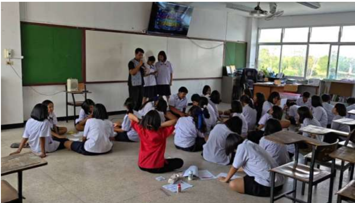
ภาพที่ ๔ ครูสุ่มนักเรียนแต่ละกลุ่มออกมานำเสนอความรู้จากการศึกษาค้นคว้า เรื่อง สวรรค์ในความเชื่อของชาวพุทธ ตามคติไตรภูมิพระร่วง ด้วยเทคนิค KWL-Plus หน้าชั้นจากนั้นครูอธิบายสรุปความรู้เพิ่มเติม